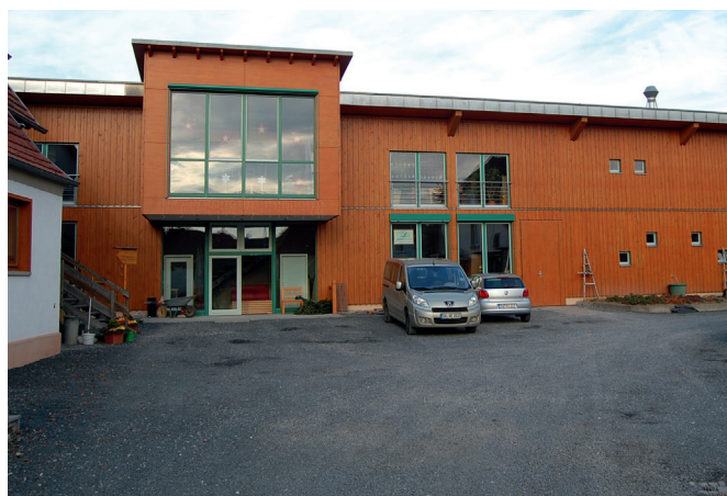
Absence d'enseigne lumineuse : la publicité de la menuiserie Eichelbrönnner ? Mais c'est la qualité !